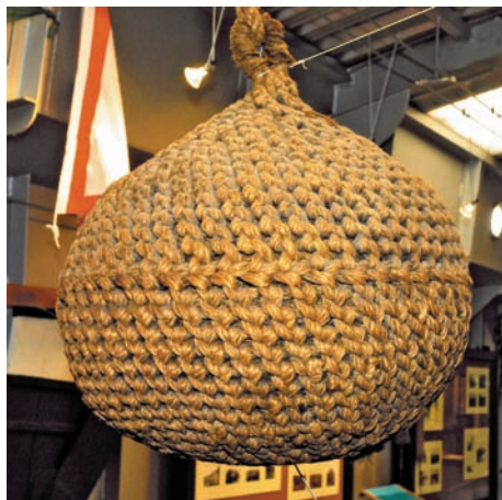
Les mariniers l'appelaient un bonget. Ces sphères de vieux cordages remplies de bouchons de bouteilles servant de défenses étaient fabriquées par les mariniers pendant les périodes de chômage.