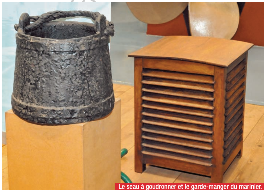
Le seau à goudronner et le garde-manger du marinier.