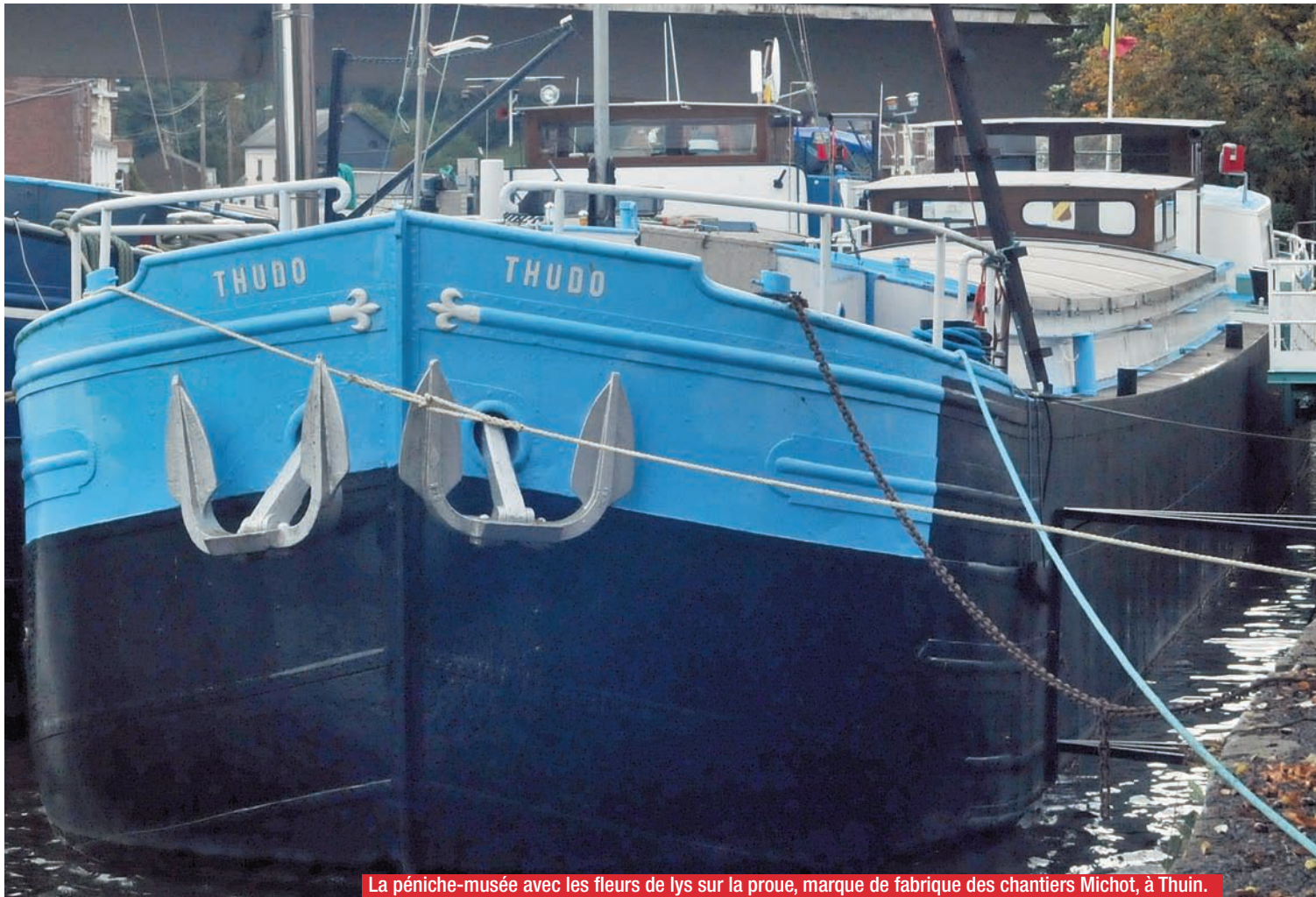
La péniche-musée avec les fleurs de lys sur la proue, marque de fabrique des chantiers Michot, à Thuin.